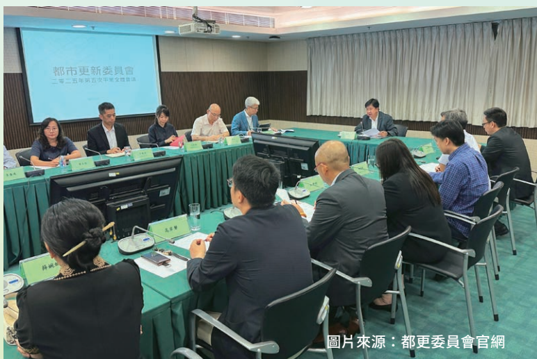
都更公司代表參與都市更新委員會 2025 年第五次全體會議