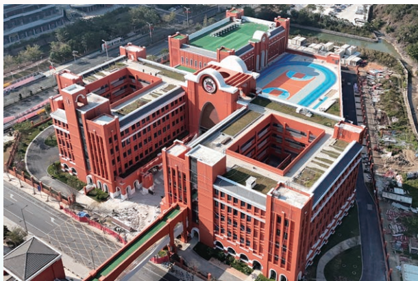
澳門新街坊中學進入最終驗收階段