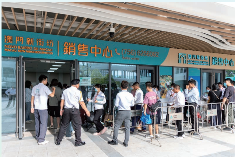
澳門新街坊全新加推第 11 棟 9月 19 日正式開售