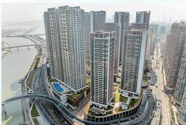
黑沙環新填海區「P」地段項目 航拍圖