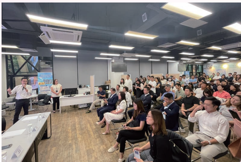
「P」地段招商簡介會 9月9日舉行