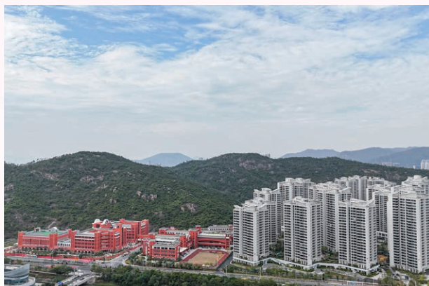
澳門新街坊住宅、小學及中學