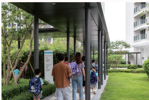
新街坊入住人數不斷提升

為建立澳門新街坊業主良好溝通及互動，及時解決業主在合作區生活上遇到的難題，搭建各政府部門與業主的指引橋樑，新街坊業主尊享服務中心以務實、積極主動的態度為業主打造全新升級體驗。2025 年度，業主親臨、電話及企業微信號查詢和協助個案共 1,986 宗。主要涉及政策諮詢（央積金異議聲請、申辦澳門單牌車、居住證、安家物品、外籍家傭到合作區、入住補貼等）、物業服務查詢（業主收樓流程查詢、裝修申請查詢、水電錶過戶手續、車位充電樁報裝查詢、小區物業管理等）、生活配套查詢和協助辦理（包括燃氣開通、家居網路開通、境外電視等）、特別個案跟進、派發公司消費券和接收業主提出的建議。