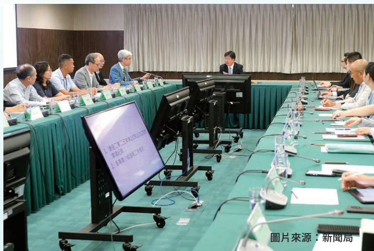
都更公司代表參與都市更新委員會 2025 年第三次全體會議