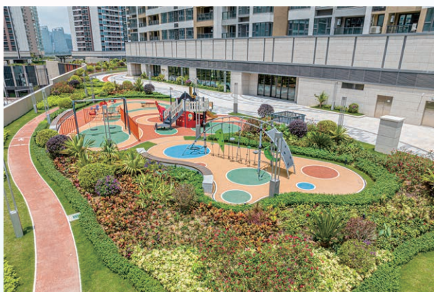
明珠都滙會所平台層

項目於 2025 年 7 月取得使用准照後，持續通過掛號郵件、短信、新聞稿以及公司網頁等