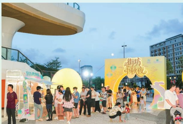
澳門新街坊中秋節活動