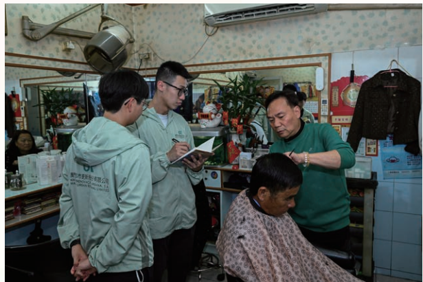
都更公司人員持續落區溝通