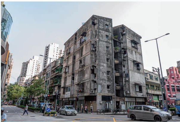
紅街市前郵電局宿舍

提供支援工作。根據由相關部門於 2025 年 9 月 30 日發出的規劃條件圖，都更公司已開展重建方案的初步研究工作，並通過會議、簡介會等形式，持續與業權人保持緊密溝通，及時更新項目信息，並就重建方案的構想、可行性等廣泛聽取業權人意願，共同推動項目重建進展。