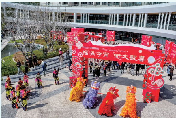
澳門新街坊元宵節活動

2025 年都更公司在社區內共舉辦 5 次不同主題的大型活動，如元宵節、復活節、中秋節、聖誕節等，結合中西文化，覆蓋不同年齡層的居民，獲得參與者一致的好評。都更公司期望透過舉辦這些活動深化街坊鄰里間的情誼，突顯澳門新街坊對居民的重視，更可以吸引潛在客戶了解社區，進一步凝聚區內人氣，增加居民歸屬感。