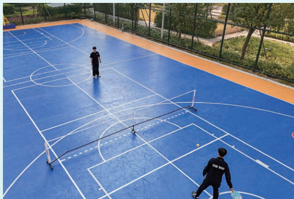
澳門新街坊匹克球場

澳門新街坊以提升住戶幸福感與歸屬感為核心，2025 年 4 月 1 日起，業主穿梭巴士延長服務時間，首班車發車時間為上午 7 時，尾班車發車時間為晚上 9 時，為澳門新街坊業主提供便利出行服務。除此以外，在 2025 年，會所更完成設施升級，在原有室外泳池、健身室等基礎上，新增普拉提室、體測室及桌球室，社區同步配套標準網球場、籃球場、匹克球場及綠化休閒平台，打造「室內外功能完備」的文體空間，構建宜居宜樂、文化交融的琴澳特色社區，延續趨同澳門的優質生活體驗。