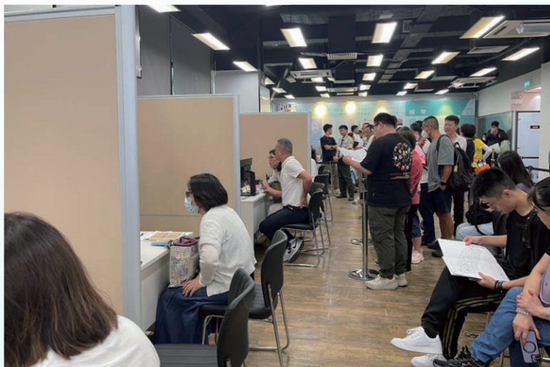
明珠都滙車位開售