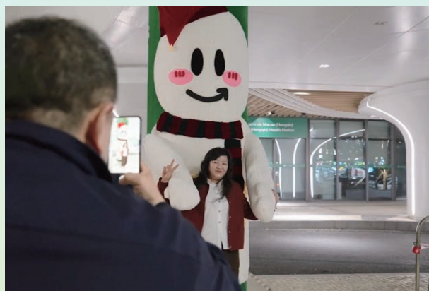
澳門新街坊聖誕佈置