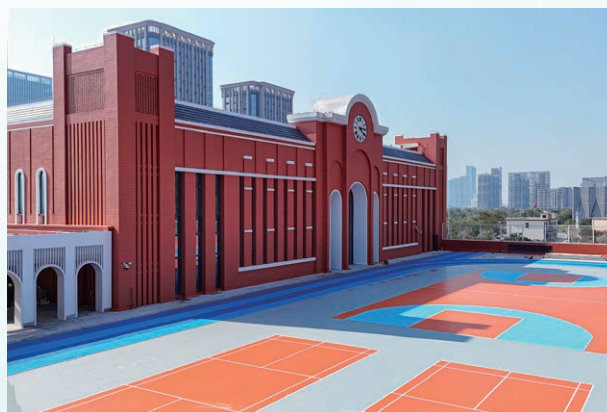
澳門新街坊中學操場