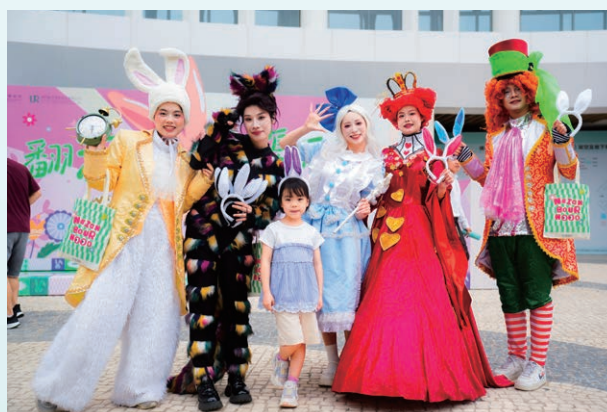
澳門新街坊復活節活動