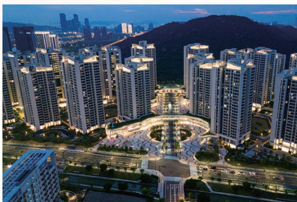
澳門新街坊夜景燈光璀璨

澳門新街坊為橫琴首個專為澳門居民而設的大型民生項目，建有學校、衛生站、家庭社區服務中心及長者服務中心，延伸澳門標準的公共服務，銜接澳門社會福利設施，營造趨同澳門的宜居生活環境。項目為澳門居民提供 4,000 套住宅單位，其中八成為兩房單位，建築面積約 88 平方米；其餘為三房單位，建築面積約 118 平方米，建築面積每平方米以均價人民幣 30,000 元出售。