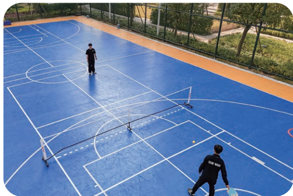
澳门新街坊匹克球场

澳门新街坊以提升住户幸福感与归属感为核心，2025 年 4 月 1 日起，业主穿梭巴士延长服务时间，首班车发车时间为上午 7 时，尾班车发车时间为晚上 9 时，为澳门新街坊业主提供便利出行服务。除此以外，在 2025 年，会所更完成设施升级，在原有室外泳池、健身室等基础上，新增普拉提室、体测室及桌球室，社区同步配套标准网球场、篮球场、匹克球场及绿化休闲平台，打造「室内外功能完备」的文体空间，构建宜居宜乐、文化交融的琴澳特色社区，延续趋同澳门的优质生活体验。