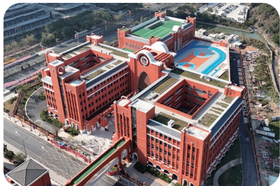
澳門新街坊正加緊中學建設