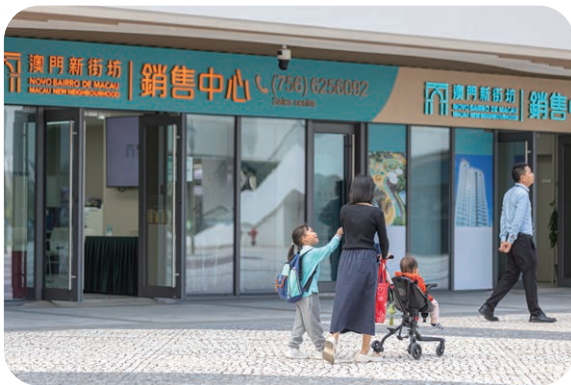
澳门新街坊销售中心

2025 年，澳门新街坊持续进行销售工作，致力为澳门居民打造优质宜居环境，同时积极提供全方位的售前与售后服务，让澳门居民获得专业咨询、贴心支援与完善配套，提升居住体验与生活品质。2025 年 9 月 19 日，澳门新街坊正式全新加推第 11 栋，同时间推出「三重优惠