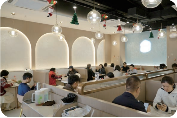
澳门新街坊商铺陆续开业，人气不断提升