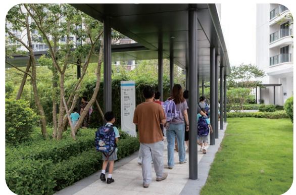
新街坊入住人数不断提升

为建立澳门新街坊业主良好沟通及互动，及时解决业主在合作区生活上遇到的难题，搭建各政府部门与业主的指引桥梁，新街坊业主尊享服务中心以务实、积极主动的态度为业主打造全新升级体验。2025 年度，业主亲临、电话及企业微信号查询和协助个案共 1,986 宗。主要涉及政策咨询（央积金异议声请、申办澳门单牌车、居住证、安家物品、外籍家佣到合作区、入住补贴等）、物业服务查询（业主收楼流程查询、装修申请查询、水电表过户手续、车位充电桩报装查询、小区物业管理等）、生活配套查询和协助办理（包括燃气开通、家居网路开通、境外电视等）、特别个案跟进、派发公司消费券和接收业主提出的建议。