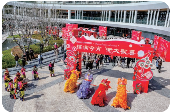
澳门新街坊举办各类型社区活动，广受好评