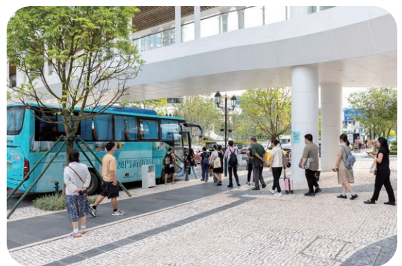
澳门新街坊延长穿梭巴士服务时间