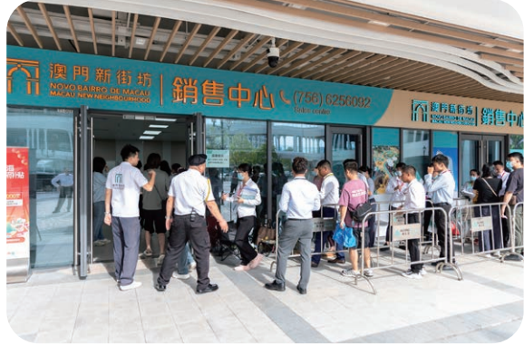
澳门新街坊全新加推第11栋 9月19日正式开售