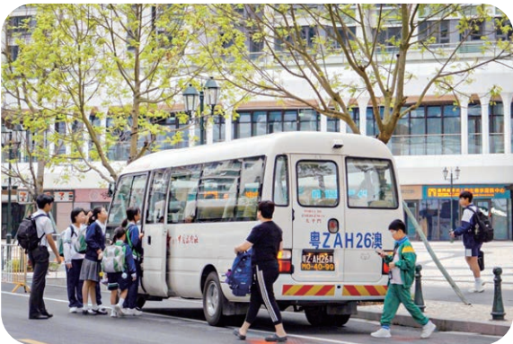
首班琴澳跨境学生专车开通，其中一上车点设于澳门新街坊