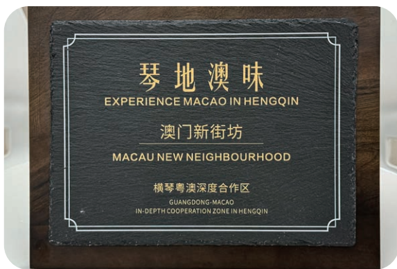
澳门新街坊获横琴合作区经济发展局颁发首批「琴地澳味」认证牌匾

横琴「澳门新街坊」持续热卖中，入住人数已超过4,000人，社区内民生及商业配套齐全，有效打造「15分钟生活圈」。澳门新街坊正加紧中学建设，持续完善区内配套设施，致力为居民提供更优质的生活环境。