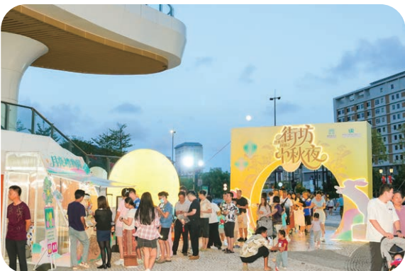
澳门新街坊举办各类型社区活动，广受好评